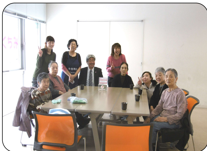
▼ H29.3.15 みちくさサロン

■主な事業は自女連時代から大切に引き継がれ、2006年に産業まつりに出店していた「おがっちゃ食堂」、2012年には「おがっちゃねふた運行」を終了することになり大変残念でした。他には「オホーツクサイクリング応援」「やすらぎの苑納涼盆踊り」「町内、町外研修」「斜里町女性大会」をはじめ、2010年から毎月15日(1月、8月を除く)に道の駅しゃりで「みちくさサロン」の事業を行ないました。高齢者から子育て中の方々など、立ち寄ってくれた方みんなが井戸端会議で元気になる居場所づくりを目指してきました。また、「ふまねっと運動」の普及と指導者養成に取り組むため、「ふまねっとサポーター養成講習」を受講し、15名が資格指定を受け、月2回斜里町老人福祉センターで講習会を開催しました。※創立50周年記念誌より一部抜粋