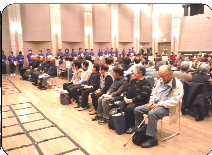
▼ R1.10.24 生きがい大学 ふまねっと講習会