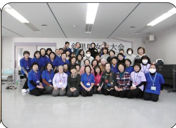
▼ H30.2.11 女性大会 ふまねっとデビュー