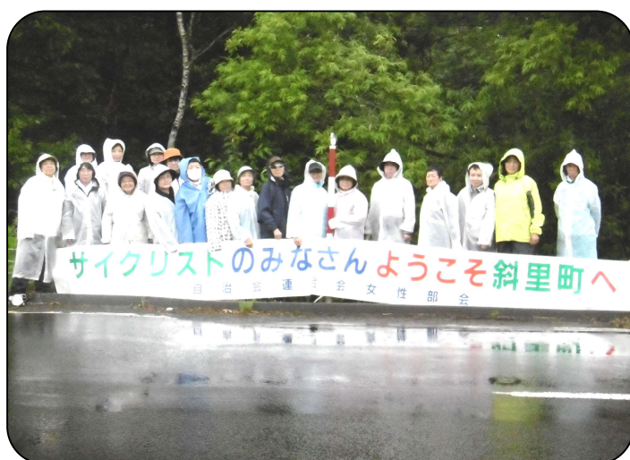
▼ R1.7.14 オホーツクサイクリング応援