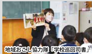
地域おこし協力隊「学校巡回司書」