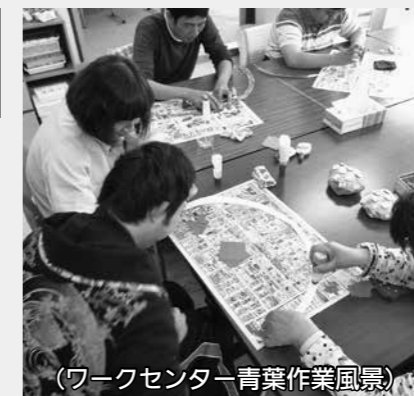
(ワークセンター青葉作業風景)

重度身体障がい者の方が、地域社会で自立した生活が出来るように介護や訓練等の支援を行います。