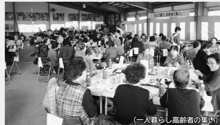
(一人暮らし高齢者の集い)

虚弱な一人暮らし高齢者や寝たきり高齢者を介護している高齢者世帯などに、緊急通報用電話機や火災報知機の貸与を行います。また、社会福祉法人の実施する介護サービス利用者負担軽減事業への助成を行います。