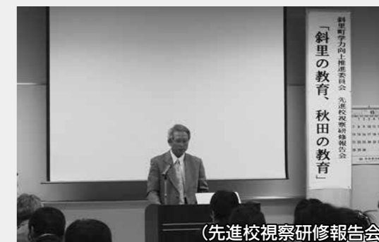
(先進校視察研修報告会)

学力向上の核となる、校長・教頭・教諭による組織「学力向上推進委員会」の運営及び研修等の活動を支援します。