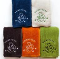
トコさん フェイスタオル