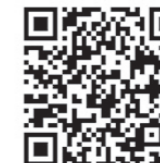
北海道総務部財政局税務課