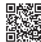
除外申請フォームはこちら