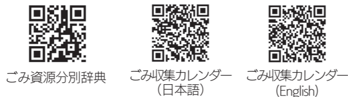
☎ 環境課 生活環境係 ☎ 0152-26-8217

ごみの分類に悩んだ際には二次元コードより確認できますので、ご活用ください。収集日カレンダーは二次元コードからもご確認いただけます。