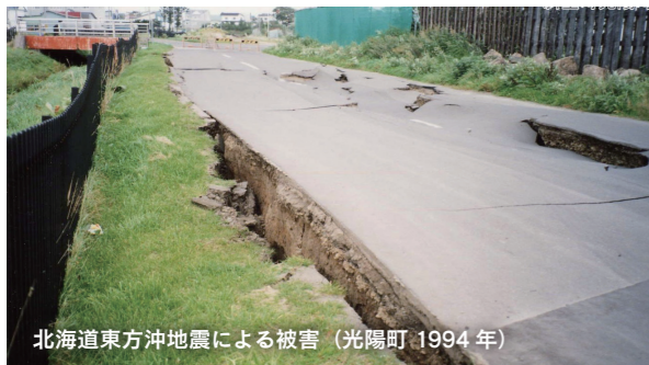
北海道東方沖地震による被害（光陽町 1994年）

地震 は予告なく、突然発生します。揺れを感じた瞬間から身を守る行動が必要です。まず頭を守り、揺れが収まったら速やかに屋外へ。