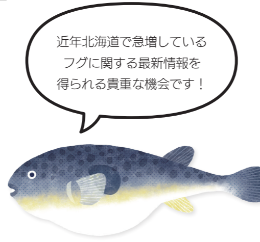
☎ 水産林務課 水産係 ☎ 0152-26-8374