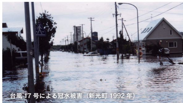
台風17号による冠水被害（新光町 1992年）

洪水 は、大雨や低気圧など気象情報をもとに事前に備えられる災害です。「まだ大丈夫」という油断が逃げるタイミングを遅らせます。