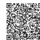
詳細はこちら(斜里町HP)