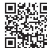
地方税お支払サイトはこちら

住所を変更された方や納税通知書が届かないという方は、お問い合わせ先までご連絡ください。 自動車税の制度については「北海道 自動車税」で検索！