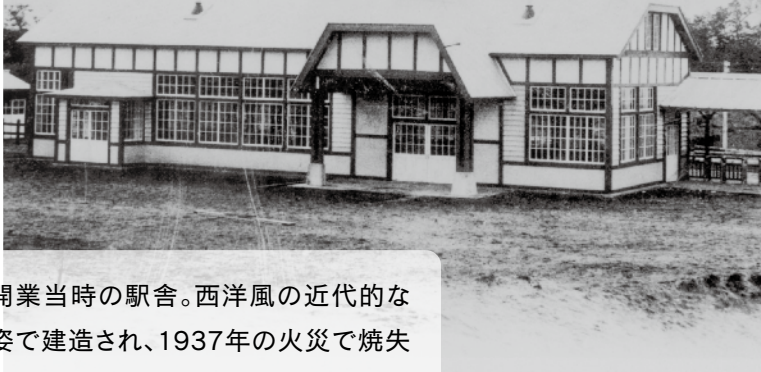
開業当時の駅舎。西洋風の近代的な姿で建造され、1937年の火災で焼失するまで斜里の町を支えていました。