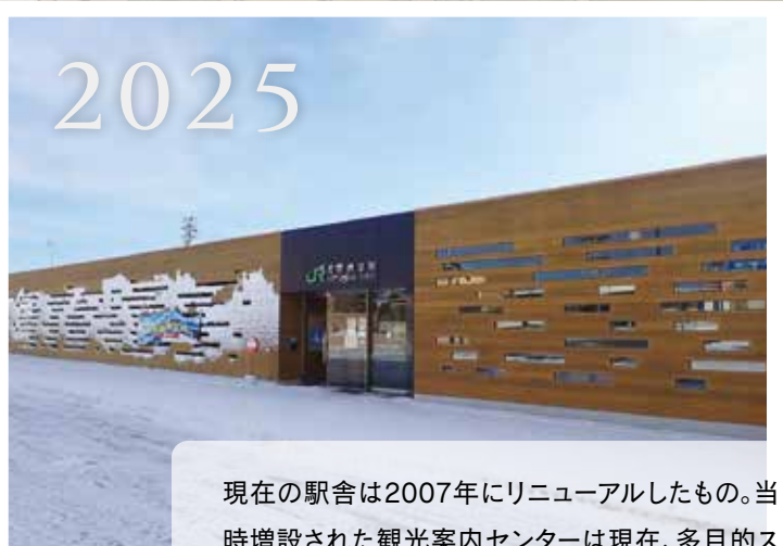
現在の駅舎は2007年にリニューアルしたもの。当時増設された観光案内センターは現在、多目的スペースとして開放され、観光客向けの記念スポットや地域住民の憩いの場として使われています。

背景の地図は、斜里駅の開業から4年後に製作された「斜里市街明細図」。今の街並みと比べながら見てみると思わぬ発見があるかも。