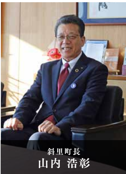
斜里町長 山内 浩彰