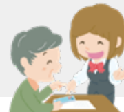
図 総務課 情報システム係 ☎ 0152-23-3131