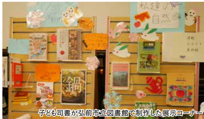
子ども司書が弘前市立図書館で制作した展示コーナー