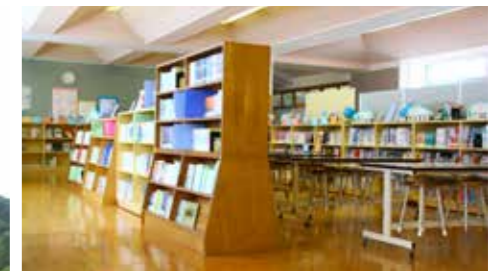
朝日小の図書コーナー。常設のもの以外に、季節や学習テーマに沿った本の展示も。