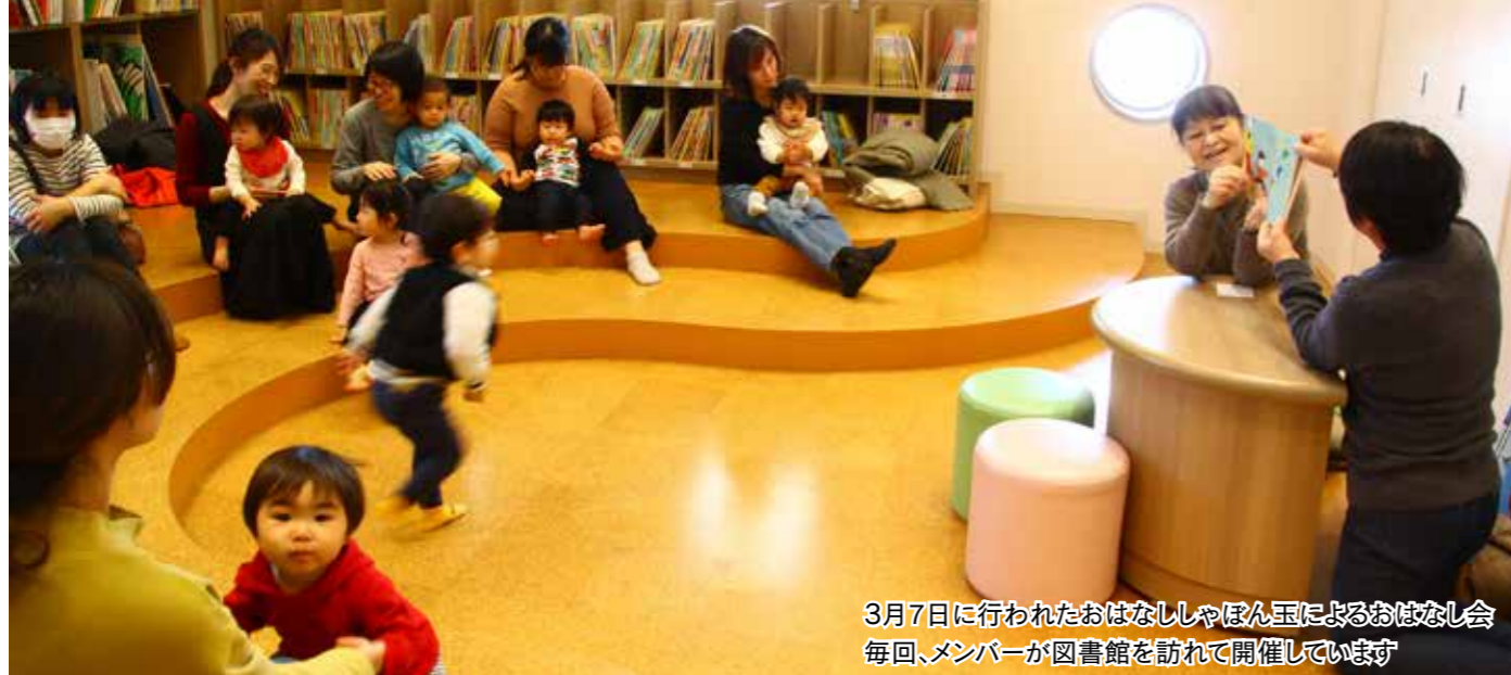
3月7日に行われたおはなししゃぼん玉によるおはなし会 毎回、メンバーが図書館を訪れて開催しています