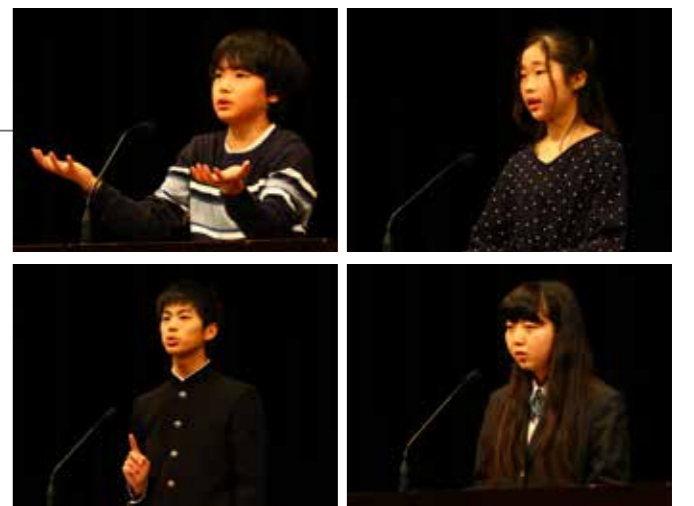
▲それぞれの部で最優秀賞を受賞したみなさん

2月23日、ゆめホール知床で斜里町「青少年の主張」大会が開催されました。小学5年生・6年生・中学生・高校生の4つの部 計21名のみなさんが出場し、身振り手振りを交ぜながら、いじめの問題や命の重さ、知床の自然や平和など、日常生活で疑問に思ったり問題だと感じたことをテーマに、自分の思いを主張しました。審査委員長の斜里町青少年健門間会長は「文献などを引用して根拠を示し、しっかり構成された発表ばかりだった」との講評がありました。