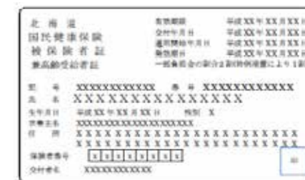
▲70歳以上の方の新しい保険証 保険証と高齢受給者証がまとまっています

保険証と高齢受給者証を兼ねることになるので、この1枚を提示するだけで、医療機関に受診できるようになります。