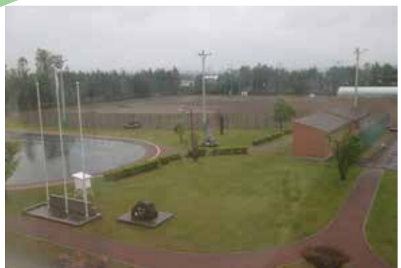
「雨の日のグラウンド」

斜里川に来た時、きれいな夕陽と空がぱっと見ていいなと思いました。友だちに立ってもらって、遠くを眺めて明日を見つめている感じに撮りました。