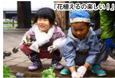
「花植えるの楽しい!」