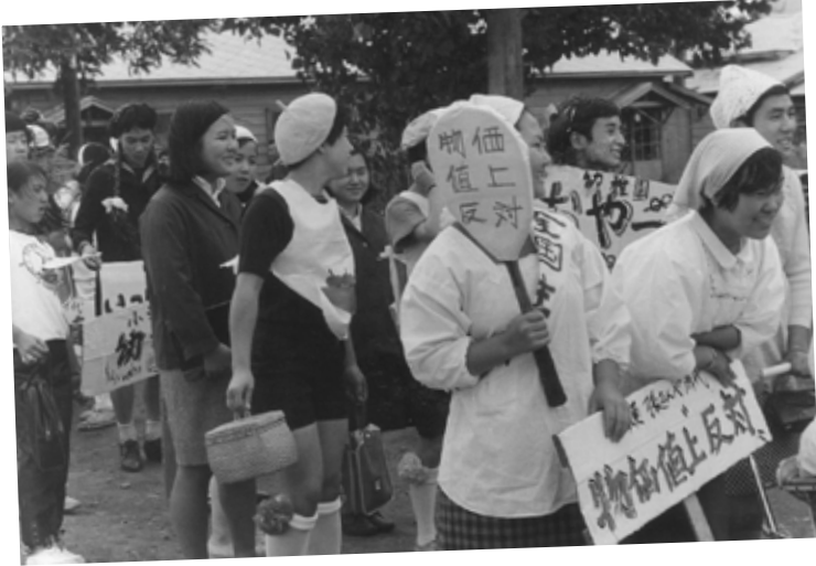
斜高祭 仮装パレード (昭和44年頃撮影)