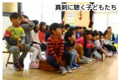
真剣に聴く子どもたち