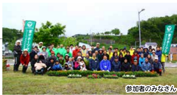
参加者のみなさん

この日はあいにく肌寒い気温の中でしたが、105名の方が集まりました。参加者の子どもたちは「お花植えるの楽しい!」「もっと植えたい!」と声を上げながら、花の苗を植えていました。