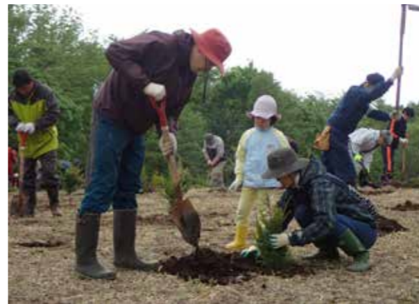
斜里町植樹祭を開催しました