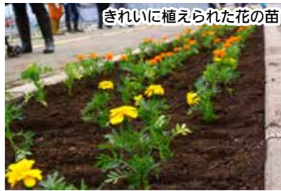
きれいに植えられた花の苗