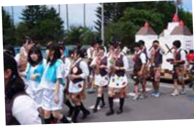
▲最後の斜高祭の仮装パレード (平成26年7月撮影)