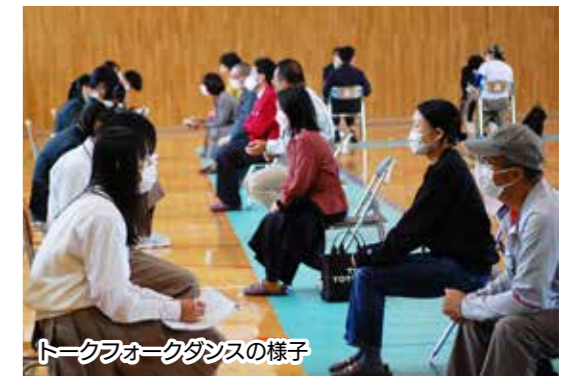
トークフォークダンスの様子

「トークフォークダンス」は、地域の様々な職業に従事している方々と対話して、会話の楽しさを体験しながら、斜里町の歴史や魅力のほか、地域の仕事や人を知ることができる機会になっています。