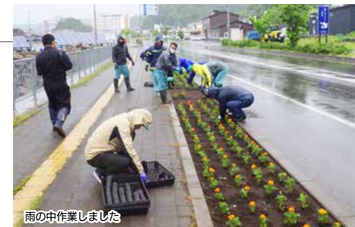
雨の中作業しました

その後、「オオイタドリ刈る狩る作戦」も行われ、ウトロトンネル付近の海もすっきり見えるようになりました。