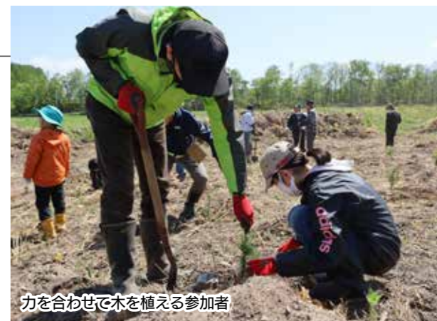
力を合わせて木を植える参加者

主催者の山内町長はあいさつで「植樹祭は木を植えながら森の大切さを学ぶ行動。斜里町は77%が山林であり環境保全の重要な役割を担っている。子どもたちには今回植えた木とともにすくすく育てほしい」と話しました。