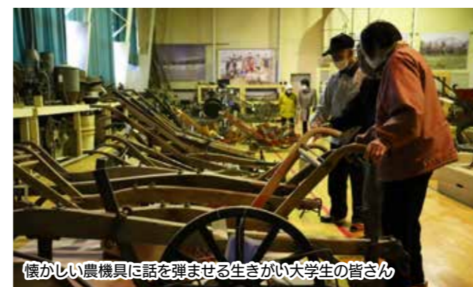
懐かしい農機具に話を弾ませる生きがい大学生の皆さん