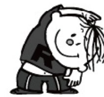
ラジオ体操坊や(ラタ坊)

今年も夏休みを利用して、各自治会の児童福祉部で「ラジオ体操」に取り組みます。ぜひ親子で、また地域の皆さんも一緒に参加しませんか? 朝の光をたっぷり浴びることで、頭がすっきりと目覚め、集中力があがります。夏休みの間も『早寝早起きごはん』の正しい生活リズムを心がけましょう。