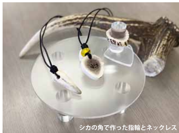
シカの角で作った指輪とネックレス