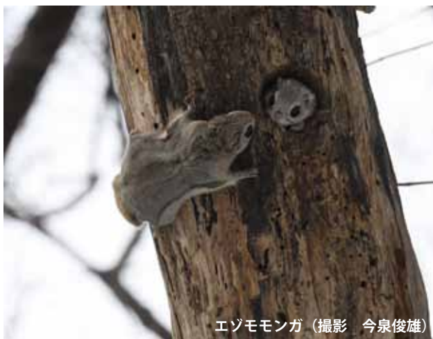
エゾモモンガ