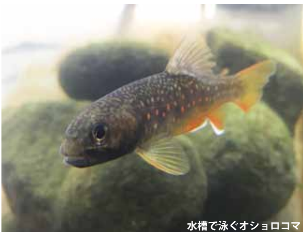
水槽で泳ぐオショロコマ