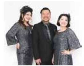
ダイナマイト しゃかりきサ～カス