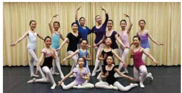
斜里バレエサークル「シルフィード」14人の出演者