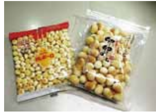
▲寄贈されたボーロ