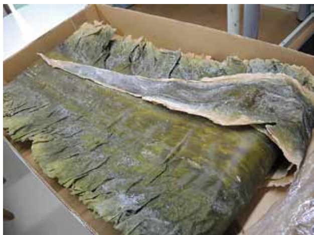
この羅臼昆布を標本にします

4月の休館日は1、8、15、22の月曜日です。4月27日から5月6日までの連休は開館しています。