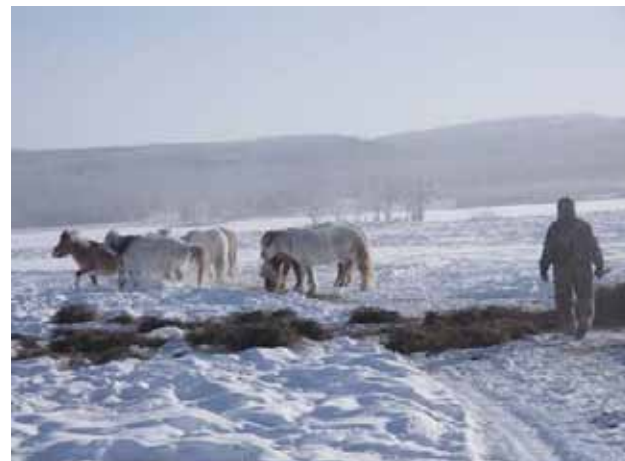
冬のウマの世話。サハ共和国オイミヤコン郡