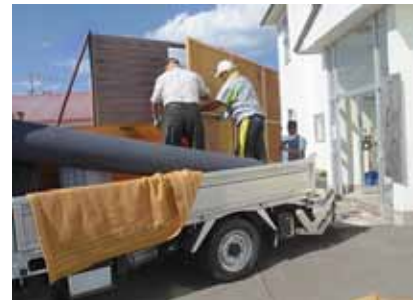
舞台セットの制作。ゆめホールには作業場所がないため文化連盟施設「ぴらが」で作り、ホールへ運びいれました。