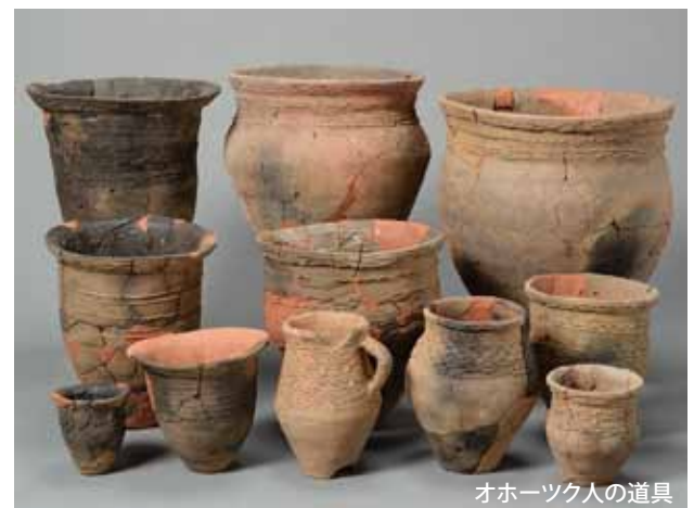
オホーツク人の道具