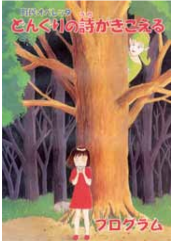
平成10年 こけら落とし