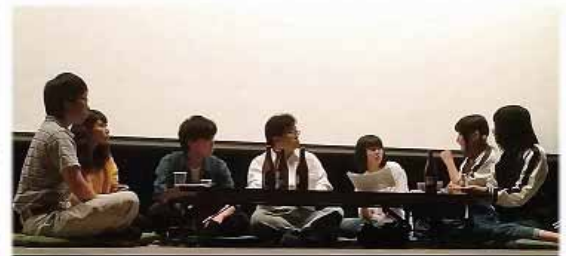
9月8日の「通し稽古」。夕食の弁当をはさんだのち21時まで「特訓」が続きました。