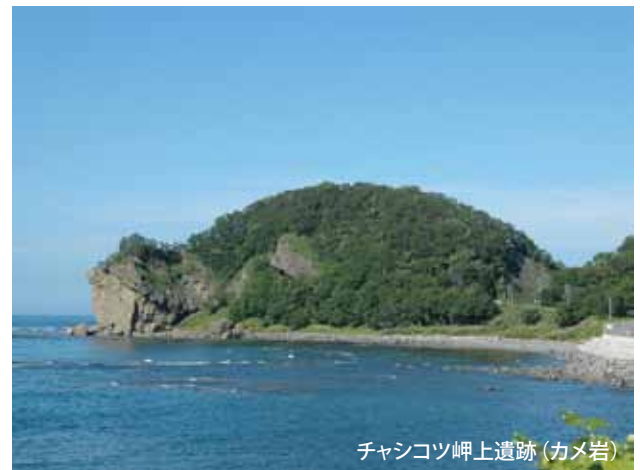
チャシコツ岬上遺跡(カメ岩)