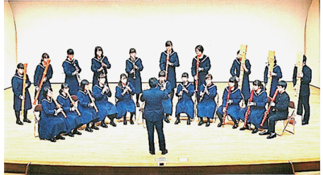
▲全道大会、演奏中の様子