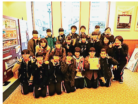
▲全道大会、表彰後の集合写真