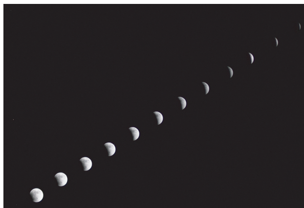
欠け始めから皆既まで(5分ごとに撮影)

当日は快晴に恵まれ、部分食の始まり(20時48分)から約3時間半に渡る天体ショーが見られました。皆既中の月は赤銅色をしていました。次回の皆既月食は今年の7月28日ですが、月食が始まるとともに西に沈むので今回ほど条件は良くありません。