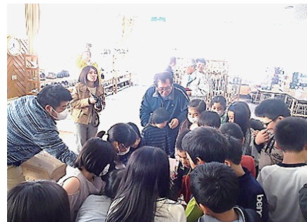
▲児童が食育授業で知床しゃりブランド認証品を手にとってしている様子