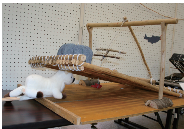
アイヌが使ったテン・イタチ用ワナを再現