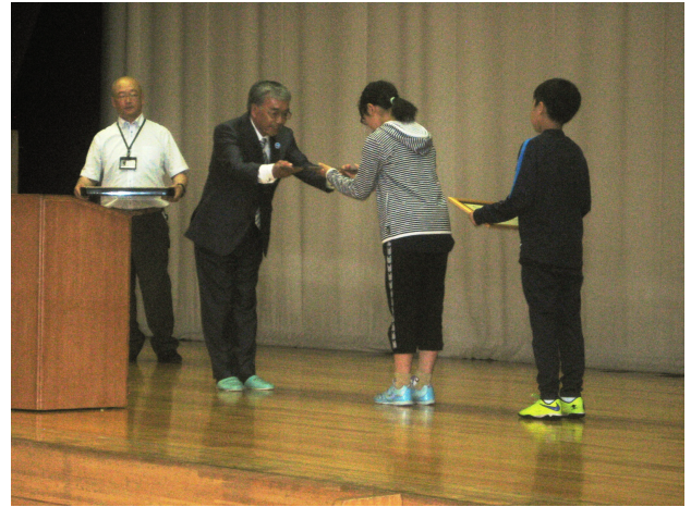
▲7月10日に朝日小学校で知床ユネスコ協会会長から、児童代表に承認書とプレートが贈呈されました。