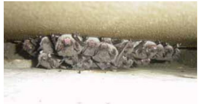
モモジロコウモリ