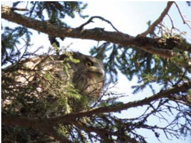
シマフクロウ