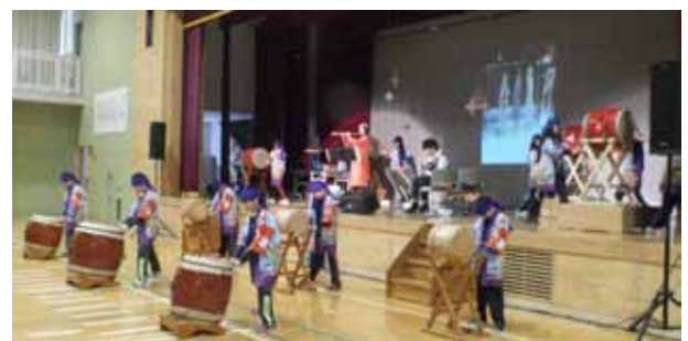
4月16日実施 知床ウトロ学校／土曜授業コンサート