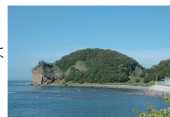
チャシコツ岬上遺跡