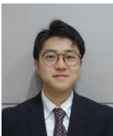
斜里中学校 戸高教諭