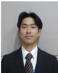
知床ウトロ学校 河原教諭