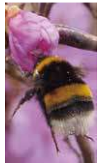
セイヨウオオマルハナバチ