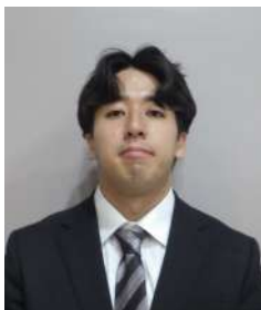
斜里中学校 松川教諭