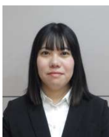
朝日小学校 柳沼教諭