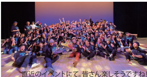
直近のイベントにて。皆さん楽しそうですね!