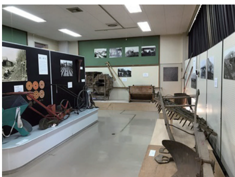
農業資料等収蔵施設