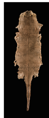
絶滅したニホンカワウソの毛皮