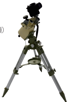
カメラをとりつけた赤道儀