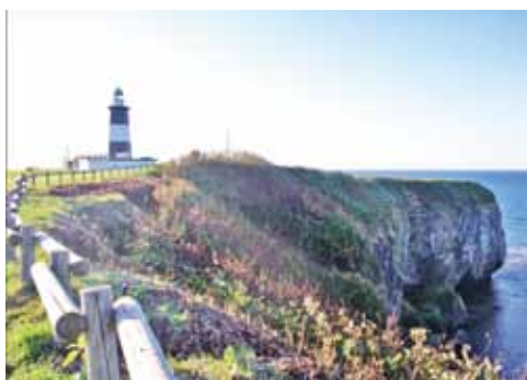
能取岬の海食台地