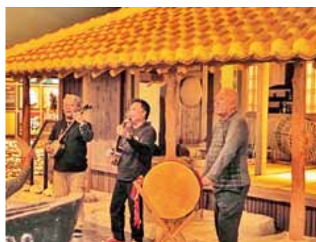
5年前のミニライブの様子