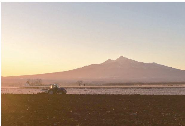
写真「大地のめぐみ」