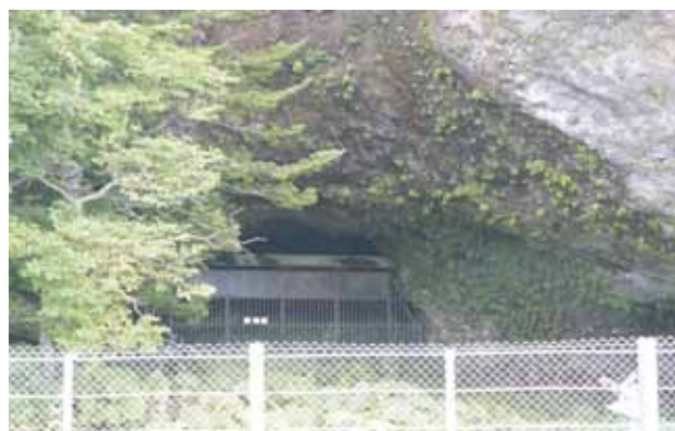
ヒカリゴケのあるマッカウス洞窟と水冷破碎岩