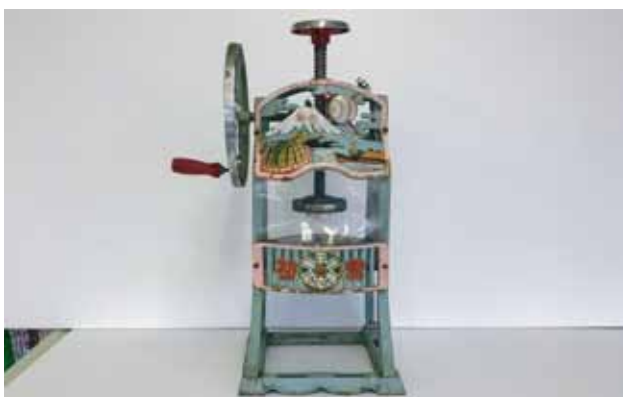
昭和レトロなかき氷製造機