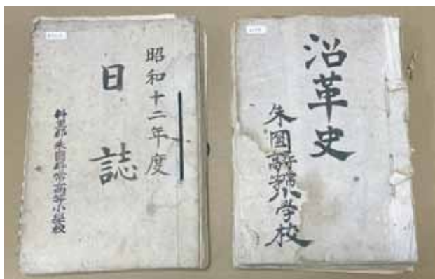
朱円小学校の沿革史と日誌