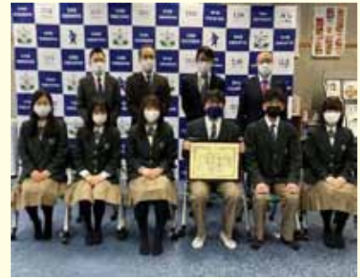
▲北海道経済産業局長賞受賞

昨年も「地方創生☆政策アイデアコンテスト2021」に出場。決勝大会への出場は逃したものの、3年連続の北海道経済産業局長賞を受賞しました。その他、新たな取組として地域の特産品をPRするため、高知県や福島県の高校生と共に、各地域の特産品を仕入れ売買する遠隔地取引も実施しました。