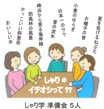
しゃり学 準備会 5人