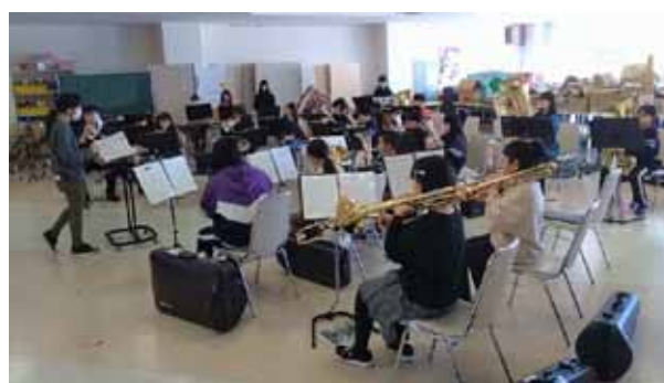
1月末の土曜練習 斜里小学校にて

顧) 今年の新入部員は14人いました。先輩たちは皆、去年の辛い経験をしています。コロナで予定していた本番が中止になっても、気持ちを切り替え、心折れずに前に進む力は、教員の心配をもものとしませんでした。また今年の6年生はチームワークがとても良く、何か問題が起きた時は、自主的に話し合っ解決しています。さらに子どもたちは練習が大好きで、休みになると「なんで休みなの？」とブーイングです。子どもたちのヤル気が私たちの原動力ですね。