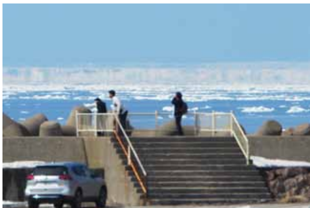
流氷の上に現れた幻氷

1953年福島県会津若松市生まれ、1978年に別海町尾岱沼白鳥台で太陽と白鳥を撮影しているとき偶然にも四角い太陽に出会ってしまった。以来、蜃気楼の魅力に引き込まれた。これまでに、地元の猪苗代湖など日本の14地点で上位蜃気楼を撮影し、うち6地点が発生の初確認であった。2016年から斜里町を中心に上位蜃気楼を撮影、特に幻氷の撮影に注力している。