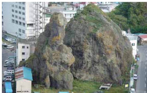
ウトロのゴジラ岩

□申込方法 件名を「配信希望」とし、お名前、電話番号を明記の上、博物館へメール(shiretoko-m@sea.plala.or.jp)してください。難しい場合は博物館へ電話にてお申し込みください。