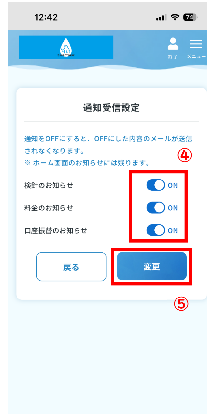
④必要のないメール通知をOFFへ変更 ⑤変更を押し確定