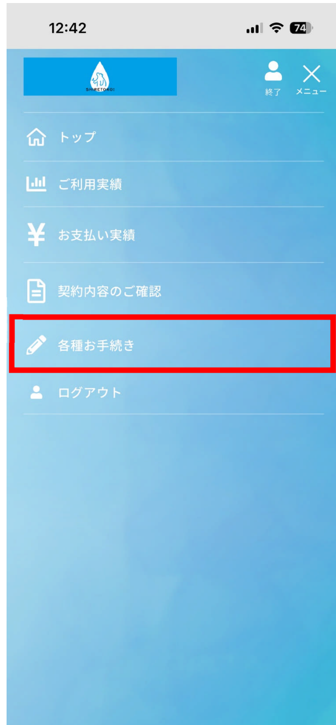
②各種手続きを選択