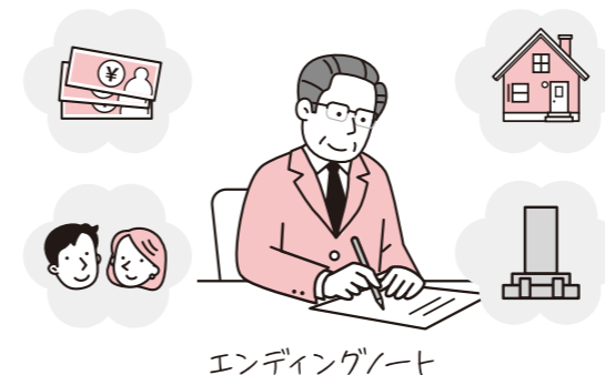
エンディングノート

遺言書やエンディングノートで、ご自身の意思を示しておく、後々相続人の手続きの負担が軽減されます。なお、遺言書は、書かれた内容が法定相続より優先されますので、誰に不動産を引き継いでもらいたいかを、きちんと明確に遺しておきましょう。また、エンディングノート(人生の終末期に備えて自分自身の希望を書き留めておくノート)は、法的な拘束力はありませんが、相続する人たちに自らの意志を遺しておくことができます。いきなり遺言書を書くのが難しい場合は、こちらから始めてもいいでしょう。