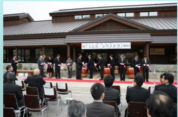
道の駅「ウトロ・シリエトク」オープンイベント