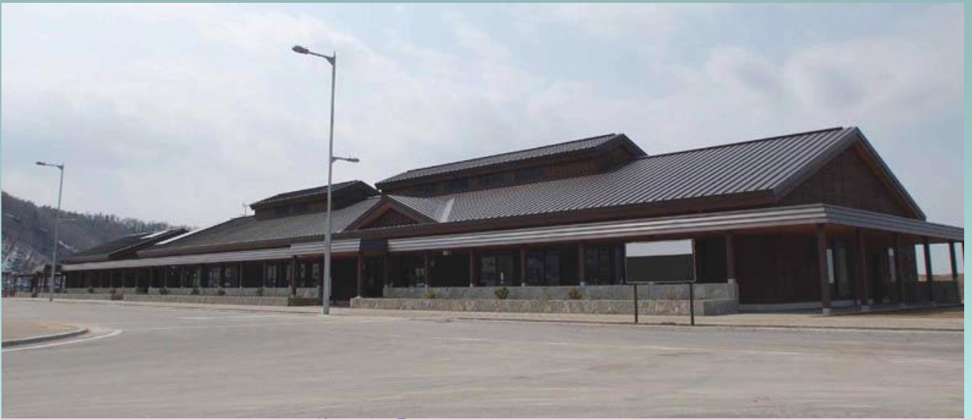
道の駅「ウトロ・シリエトク」