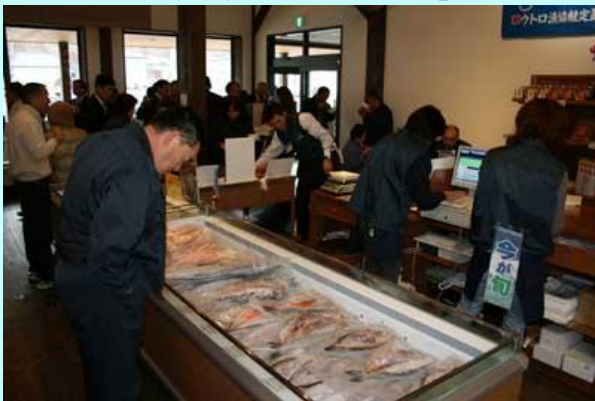
ウトロ漁協直売店「ごっこや」