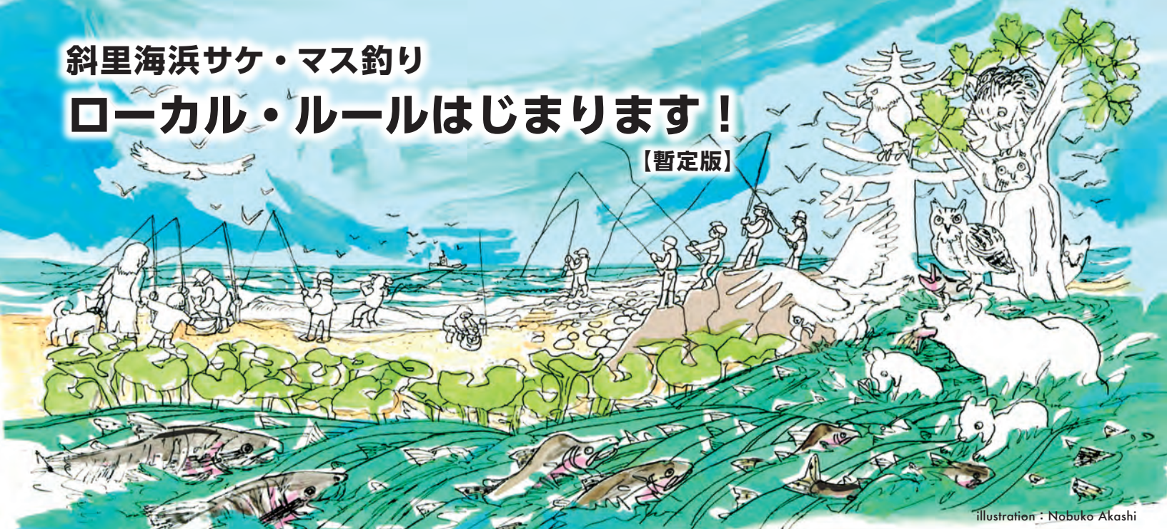
illustration : Nobuko Akashi

美しい海浜と豊かなサケ・マス資源は、斜里町の大切な財産です。これらの持続可能な利用を目指すため、斜里町海浜利用適正化検討協議会からの提言に基づいて、斜里海浜サケ・マス釣りのローカル・ルール（暫定版）を作成致しました。来訪される皆様には、このローカル・ルールを尊重してサケ・マス釣りを楽しんで頂きますようご協力をよろしくお願い致します。