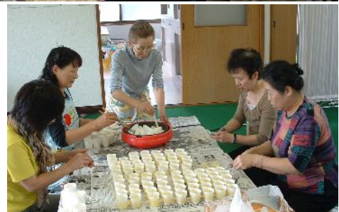
写真上:6日間に渡り、延べ30人の役員が『セタライトダウン』と『交通事故死ゼロ1000日達成記念』のローソク1,500個作りしました。