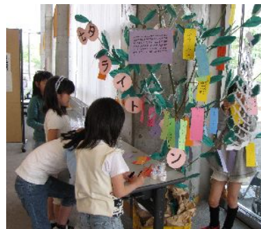
写真上:ゆめホール知床のロビーで

もったいない運動の一環として、7月7日に「2時間電気の明かりを消しましょう!」とライトダウンを行いました。柳の枝に来場された方が書いた短冊を吊るし、ローソクを持ち帰っていただきました。