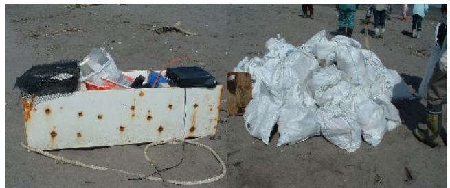
(写真上: 前浜に捨てられていたゴミ)