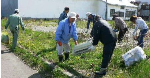
(写真上: 斜里川河口付近の清掃・港町第2自治会)