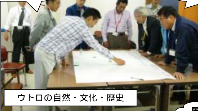
ウトロの自然・文化・歴史