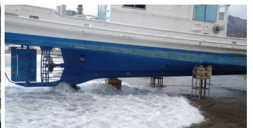
波が遡上するため危険な船揚場

改訂マリンビジョンの実現に向けて関係機関と協力しながら取り組みを進めていきます！