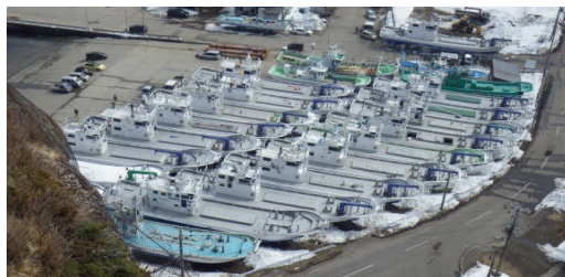
船間が密着しているため整備作業が困難