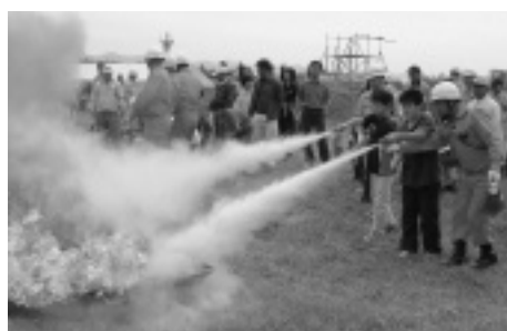
前回は平成15年に実施。消火器を使った消火訓練もありました。(今年も実施予定。)

突然やってくる災害の被害を最小限に食い止めるには、自らの適切な行動と、互いに助け合う体制の確立が重要です。そこで、行政及び各防災機関の実践的な訓練の実施による災害対応能力の向上と、住民や地域団体が参加することにより、自主防災意識を高めることを目的として、「斜里町総合防災訓練」が、次のとおり日程で開催されます。 当日は、大規模災害を想定した水防訓練や、住民避難訓練、救助袋を使った降下訓練を行うほか、防災用品展示コ