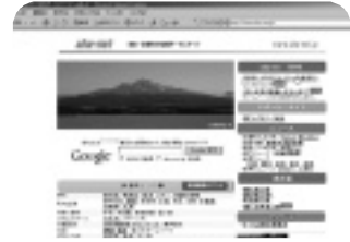
ポータルサイト「しゃねっと」